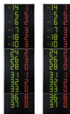
Art.262E FS-414E Pannelli laterali 2x14 giocat.(n°maglia + falli + punti), cifre 15cm Dimensioni: 2x 80x300x11,5cm. - Peso: 117kg.