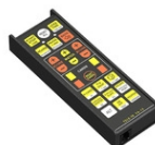
Art.938-12 Telecomando infrarossi per FA-15 Parte ricambio Dimensioni: 16x6x5cm. - Peso: 0.3kg.