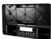
Art.0177-2620 FA-15 contenitore parte posteriore in plastica nera Parte ricambio Dimensioni: 35x21x8cm. - Peso: 0.3kg.