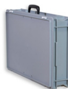
Art.948 Valigia per Torri Luci e Supporto da tavolo per FA-07 Può contenere anche la batteria art.828 e il caricabatteria art.829 Dimensioni: 60x40x13,5cm. - Peso: 3.8kg.