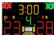
Art.940 FA-07 con telecomando, alimentatore e valigia Dimensioni: 60x40x13,5cm. - Peso: 8.1kg.