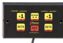
Art.346 ...TASTIERA per PLAY20V-30V, con cavo 1,3m Parte ricambio Dimensioni: 15,5x9x1,6cm. - Peso: 0.43kg.