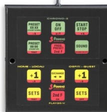
Art.352 ...TASTIERA per PLAY20C-30C, con cavo 1,3m Parte ricambio Dimensioni: 15,5x16,2x1,6cm. - Peso: 0.72kg.