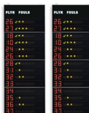
Art.262B FS-414B pannelli laterali 2x14 giocatori (n°maglia + falli) Dimensioni: 2x 120x320x11,5cm. - Peso: 168kg.