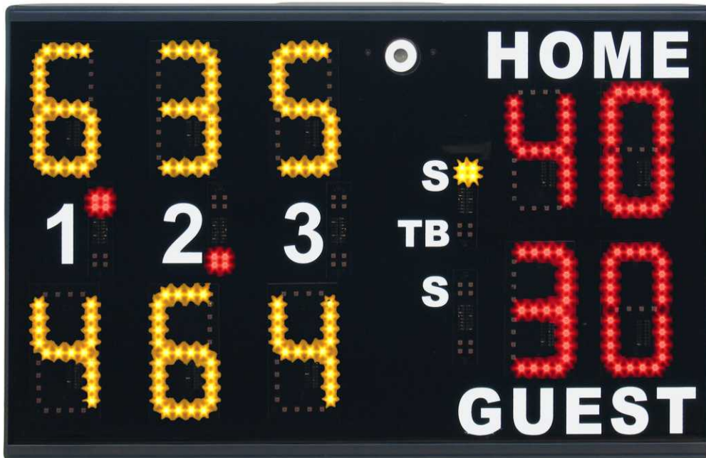
Art. 166 PS-T