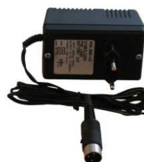
Art. 169A (Option) Battery charger