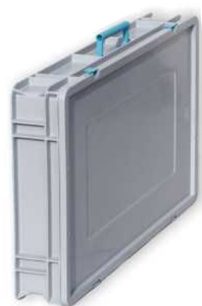
Art.167 (Option) Carrying case