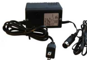
Art. 169B (Option) Battery charger