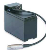
Art. 828 (Option) Battery