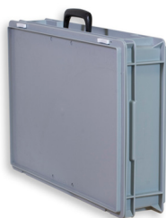
Art.852 Box 04 (Option)