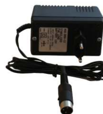
Art. 169A (Option) Battery charger