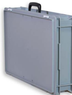
Art.167 (Option) Carrying case