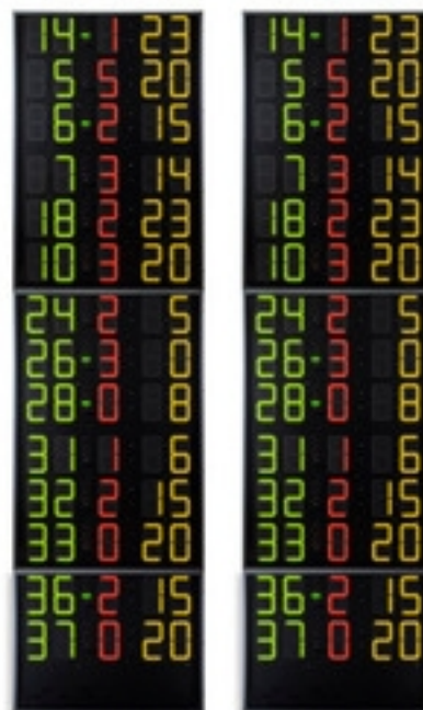
Codes articles et prix (hors TVA)