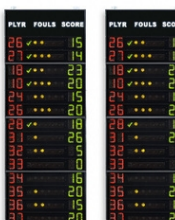
Art.262C FS-414C paneles laterales 2x14 jugadores (nº dorsal +faltas +puntos) Dimensiones: 2x 120x320x11,5cm. - Peso: 172kg.