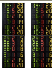
Art.260E FS-412E Paneles laterales 2x12 jugadores (nº Dorsal + Faltas + Puntos), Dígitos 15cm Dimensiones: 2x 80x240x11,5cm. - Peso: 95kg.