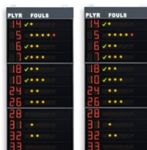
Art.260B FS-412B Paneles laterales 2x12 jugadores (nº dorsal + faltas) Dimensiones: 2x 120x260x11,5cm. - Peso: 136kg.