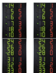
Art.260D FS-412D Paneles laterales 2x12 jugadores (nº Dorsal + Faltas), Dígitos 15cm Dimensiones: 2x 80x240x11,5cm. - Peso: 93kg.