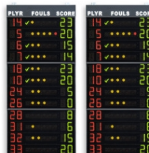
Art.260C FS-412C paneles laterales 2x12 jugadores (nº dorsal + faltas + puntos) Dimensiones: 2x 120x260x11,5cm. - Peso: 139kg.