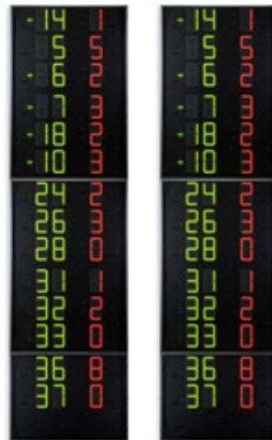
Artikelnummern und preise (zzgl. MwSt.)